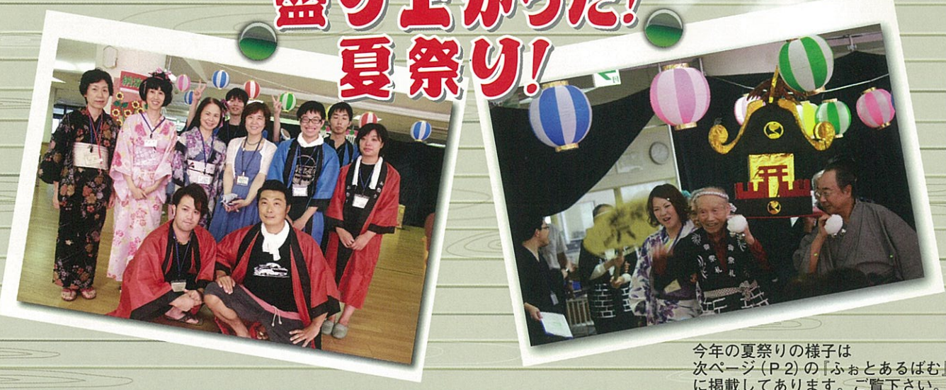
今年の夏祭りの様子は次ページ(P2)の「ふぉとあるばむ」に掲載してあります。ご覧下さい。