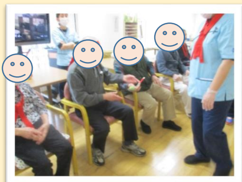
「おたまでちよいっと」