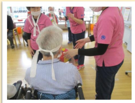
「ビーチボールほい」