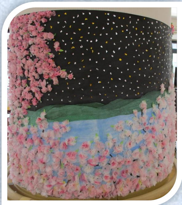
夜空の下の、桜です♪

今年は早く咲き始めた桜、咲いてから寒くなり、驚く事に雪も降りましたね！ 寒さのおかげで長く咲いてましたね♪レストア内でも利用者さまが 桜を咲かせてくれましたよ！色んな桜が咲いてます（^^）