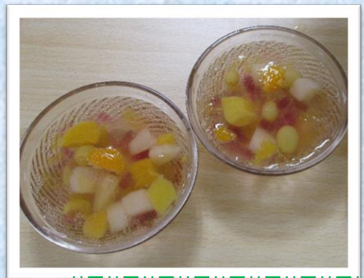
手作りおやつでは 「フルーツポンチ」でした！