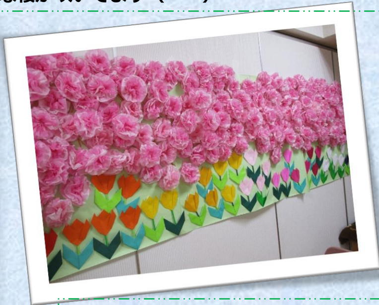
満開の桜の下には色とりどりの チューリップが咲いています° ♪