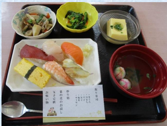
4/9（木）「お寿司の日」でした。