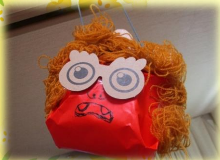
かわいい鬼たちが来たよ～！