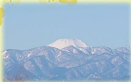
翌日はとってもキレイな富士山