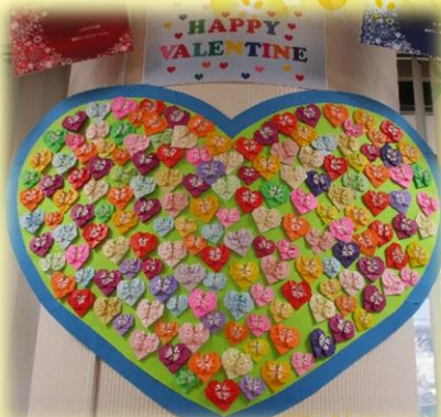
ハッピー♡♡バレンタイン♡♡