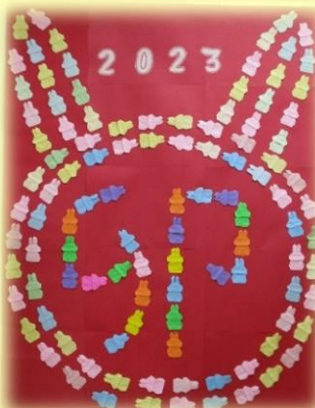
可愛い小さなウサギさんが集まって【卯】