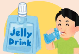
エネルギーゼリー