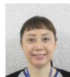
奈良 (主任ケアマネ)