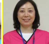
奈良 (主任ケアマネ)